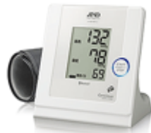
イー・アンド・デイ UA-851PBT-C