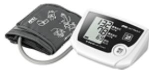
イー・アンド・デイ UA-772NFC