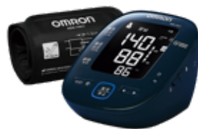
オムロンヘルスケア HEM-7281T (※近日対応予定)