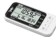
イー・アンド・デイ UW-201NFC