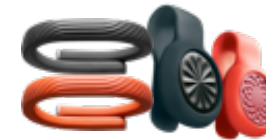
JAWBONE UP 各種