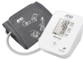
イー・アンド・デイ UA-651BLE