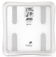
イー・アンド・デイ UC-411PBT-C