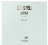
イー・アンド・デイ UC-352BLE